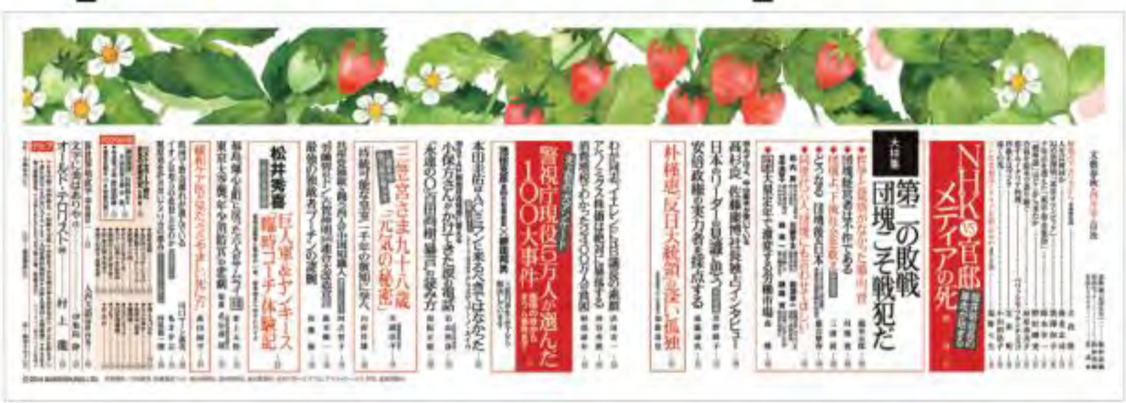
1 じほう [雑誌表紙] ADクニメディア