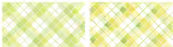
「白ぶどう」の背景。左が中間チェックの際のもので、右が納品段階のもの。比較すると、描きこみの具合が違うのがわかる。